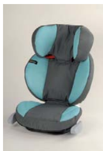
Un rehausseur de siège avec dossier en 2009.

Plus de sécurité pour les enfants dans les bus scolaires et les voitures: Le Conseil fédéral a approuvé plusieurs modifications d'ordonnance. A partir d'avril 2010, les enfants mesurant moins de 150 centimètres devront être protégés jusqu'à l'âge de 12 ans par un dispositif spécial de retenue pour enfants. Ainsi, la sécurité des enfants dans les bus scolaires et les voitures s'en trouvera renforcée à l'avenir.